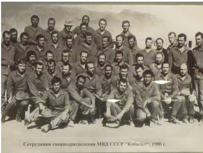
Сотрудники спецподразделения МВД СССР "Кобальт". 1980 г.